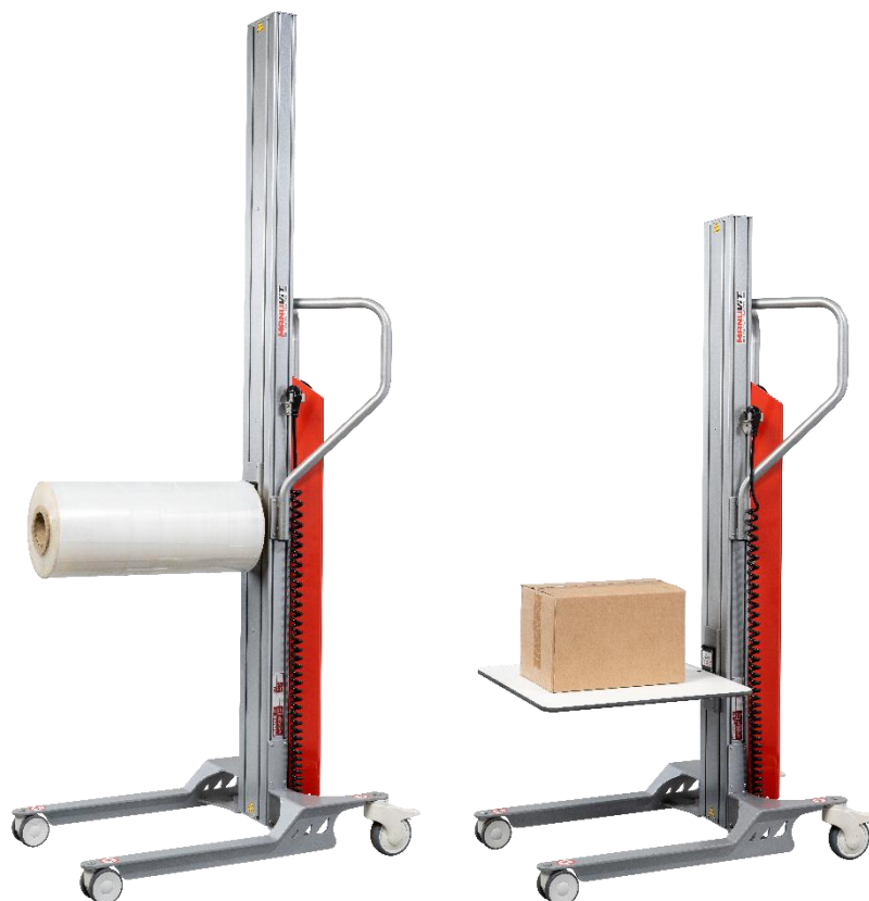
Équipé de l'accessoire éperon

Conformes à la directive machine 2006/42/CE. Répondent aux recommandations de la CRAM R-367.