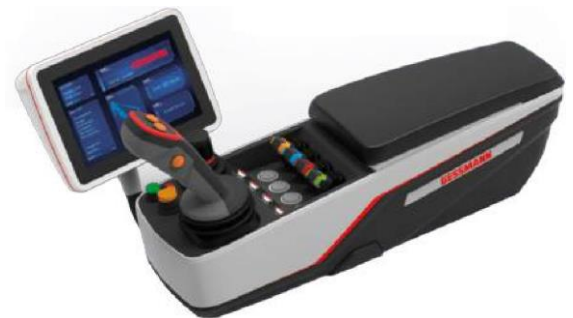
Exemple de configuration