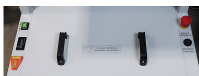
Indicateur de batterie et commandes centrales