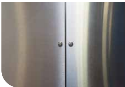
CHÂSSIS ET CARÉNAGE TOUT INOX