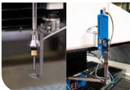
ÉQUIPEMENT STANDARD : Palpeur de hauteur/planéité, Doseur d'abrasif piloté