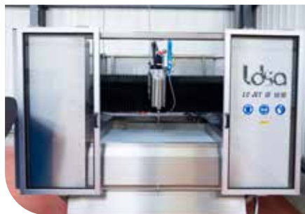
MACHINE COMPACTE ET RIGIDE