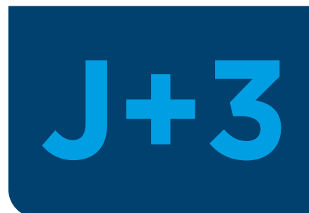
INSTALLATION RAPIDE SOUS 3 JOURS