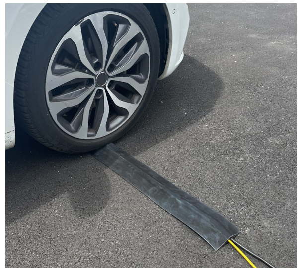
VOLGA sans adhésif