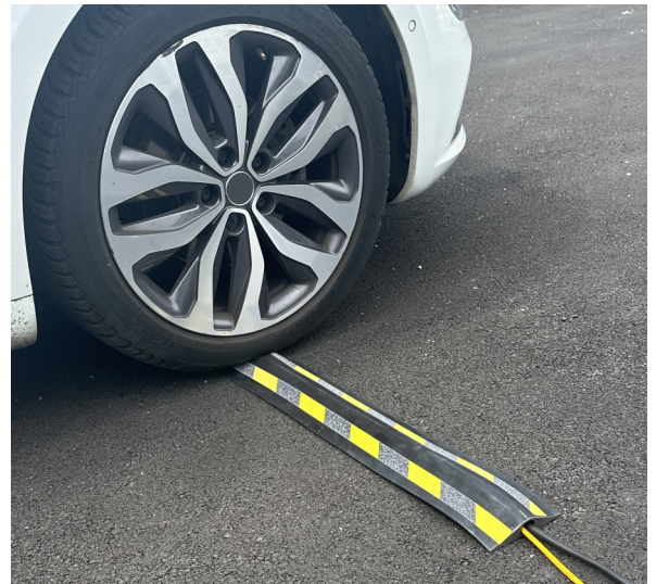
VOLGA avec adhésif